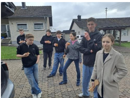
für St. Donatus Gronig von Klaus-Peter Schuch