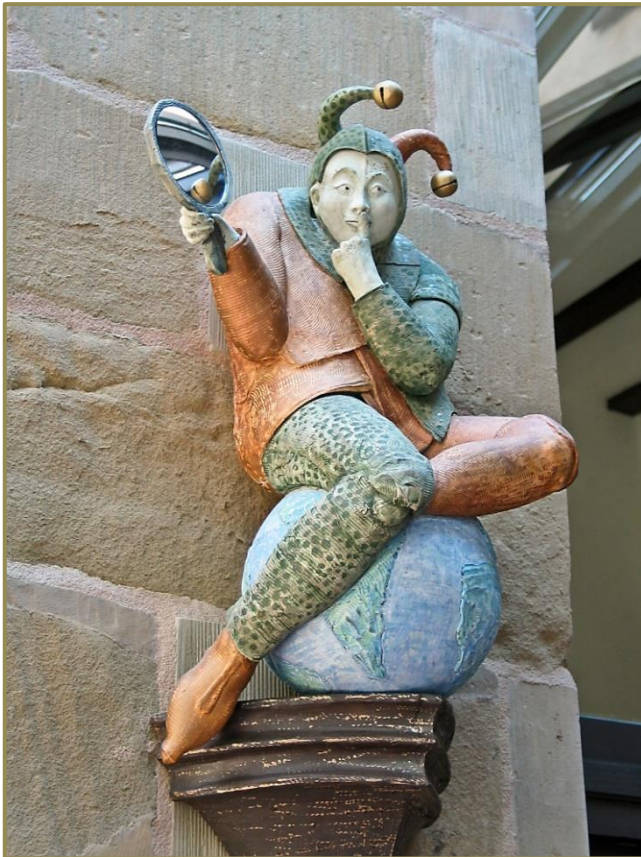
"Narr auf der Weltkugel"

(aus dem Speisesaal des ehemaligen Augustinerklosters in Erfurt)